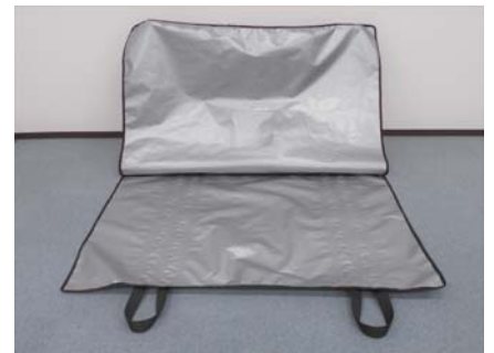
サイズ大（開いた状況）